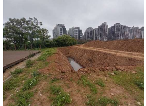
監控鄰近校區地段土石情形