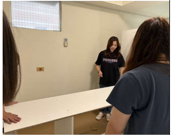
自行採購家具組裝