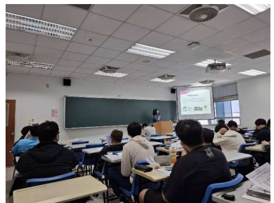
2026 交換生計畫入班宣傳