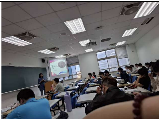
2026 交換生計畫入班宣傳