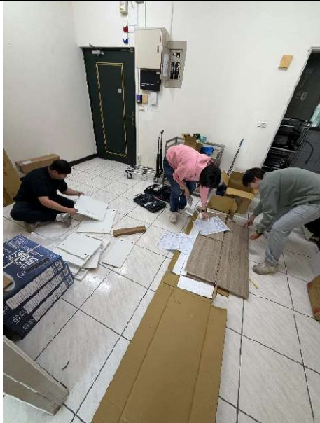
自行採購家具組裝