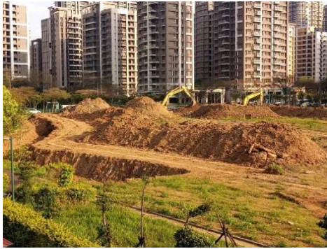
華夏科大進行整地