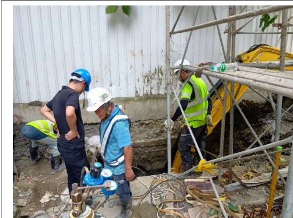
南向污水外管施工