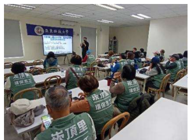
里環保志工參與課程