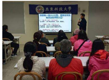
里長擔任課程講師