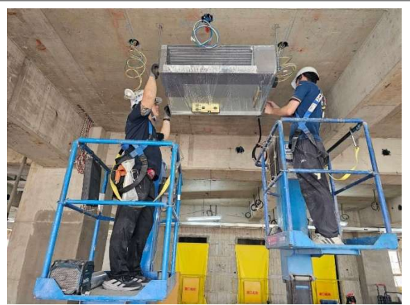
10F VRV 室內機吊裝