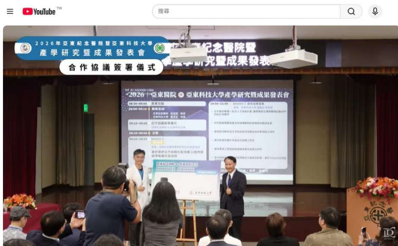
2026亞東紀念醫院暨亞東科技大學產學研究暨成果發表會紀錄 #遠東集團 #亞東科大 #亞東醫院 #產學合作

三、本年度亞醫成果展於 115 年 04 月 17 日辦理完成，共計 213 人與會；相關新聞稿已公告於學校網頁，活動影片亦已製作完成並上線，研習證書已於 04 月 23 日發送，並同步以電子郵件通知，同時宣傳 07 月 20 日辦理之次年度亞醫案媒合會。