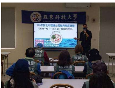
4/6 里民環境教育課程