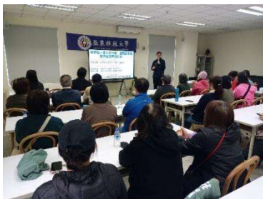
3/21 里民環境教育課程