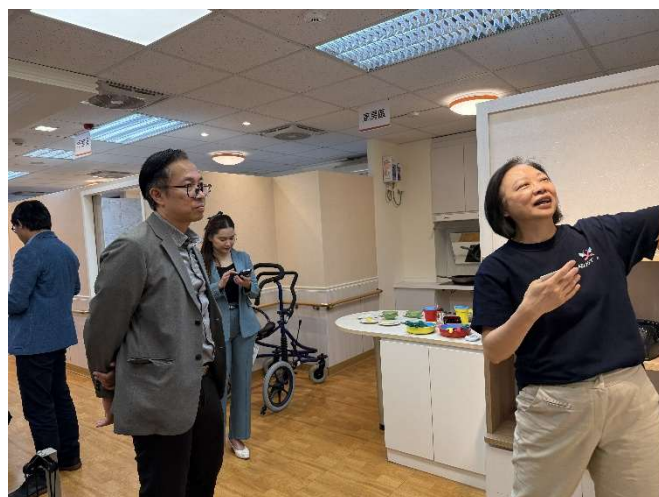
參訪特色實驗室(護理系長期照護教室)