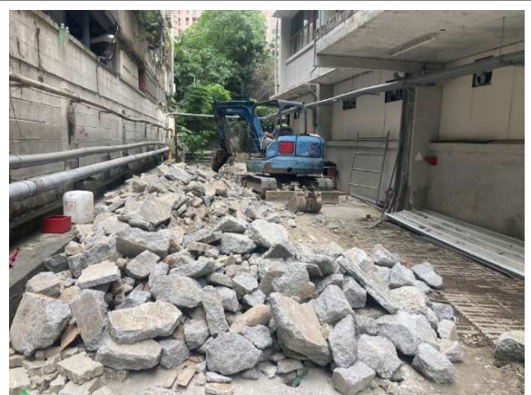
實習大樓南側景觀 PC 面層破碎