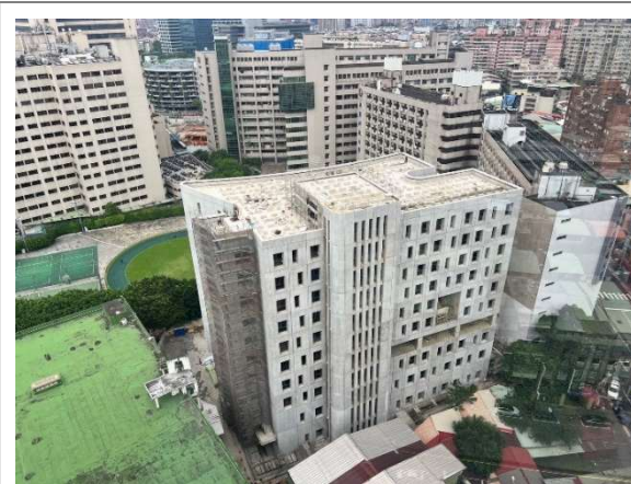
屋頂現況(前次報告)